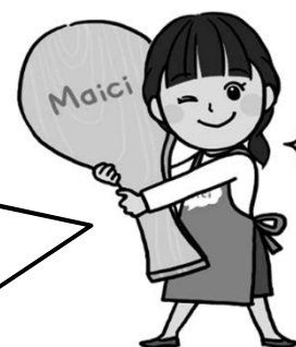
マイシィご案内役 りこちゃん