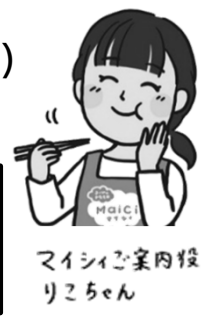
マイシイご案内役 りこちゃん

12/27(月)は通常メニューの他「牛すき煮重」もお選びいただけます。 通常週3日コース、また月曜日にご利用がない方もご注文できます。 年の瀬のごちそうに、ご注文お待ちしております♡