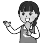
マイシィご案内役 りこちゃん

5月3日(金)～6日(月)の4日間は<数量変更・お休み お申し込みカード>の回収も行っておりません。お早めのご提出をお願いいたします。